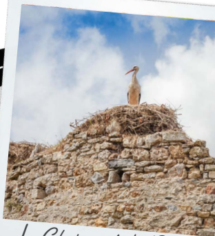
Le Château de La Rivière de Saint-Fromond