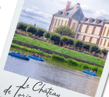
Le Château de Torigny-les-Villes