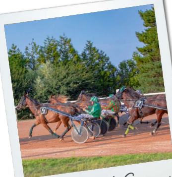
L'Hippodrome de Graignes