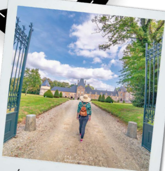
Le Château de Canisy