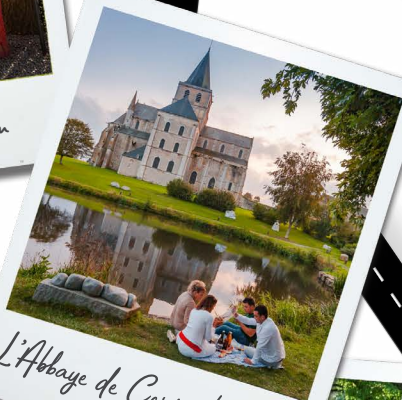
L'Abbaye de Cerisy-la-Foret