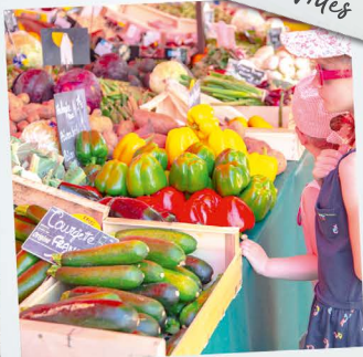
Les Marchés d'été à Saint-Lô