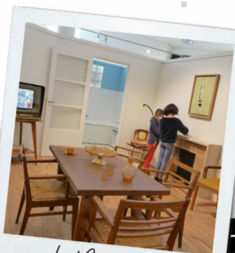
Le Musée d'Art et d'Histoire de Saint-Lô