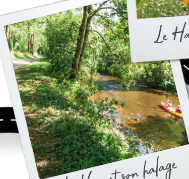
La Vire et son halage