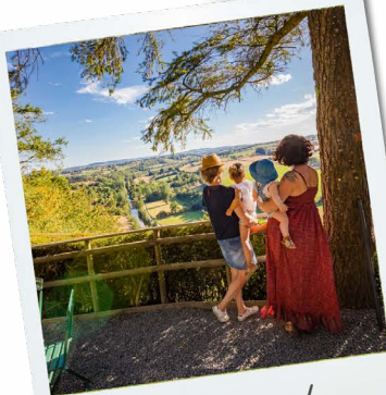
Les Roches de Ham