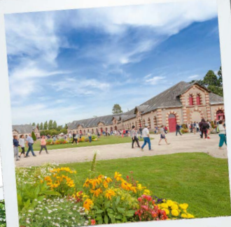
Le Haras de Saint-Lô

Le Château de Montfort de Remilly-les-Marais