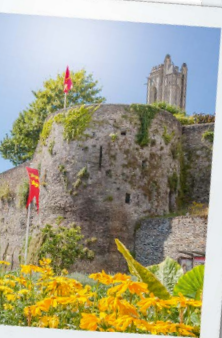
parts de Saint-Lô