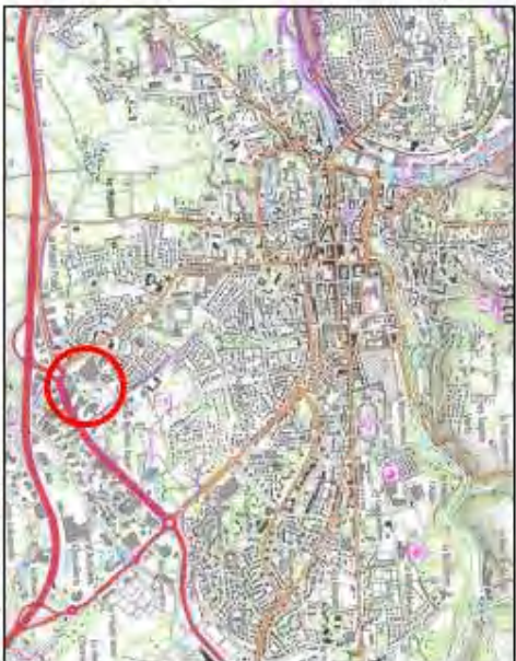
Document sans échelle

Téléphone : 02 33 72 62 80 Télécopie : 02 33 72 62 81 E-mail : agence@stlo.gesmat.fr