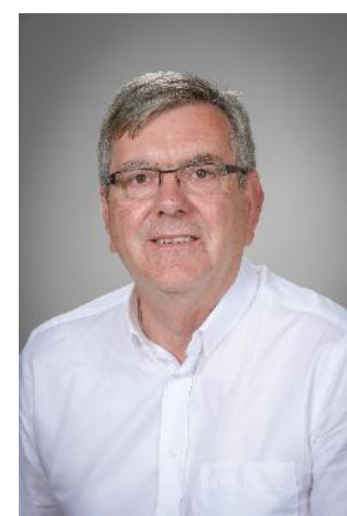
Jean-Pierre LEDOUIT Maire de Cerisy la Forêt