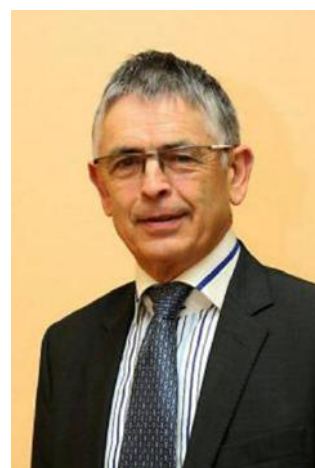
Henri-Paul TRESSEL Maire de Bourgvallées